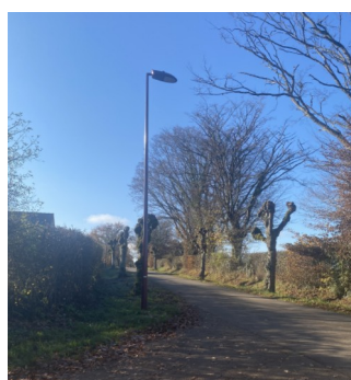
Réverbères rue des tilleuls

- Au cimetière : la végétalisation des allées est en cours, afin de palier à l'interdiction des pesticides. Par contre les travaux de maçonnerie sur le mur d'enceinte du cimetière sont toujours à l'étude et ne pourront probablement pas être réalisés avant 2024.