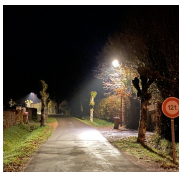
Éclairage rue des tilleuls