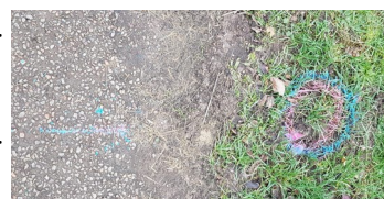
Marquage au sol

Cela permettra de mettre à jour tous les travaux réalisés sur notre réseau depuis 2010. Le SIAEP de CORBIGNY disposera ainsi d'informations plus complètes, détaillées et précises sur son patrimoine eau, que celles dont nous disposions avec le 1 er diagnostic.