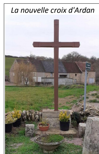
La nouvelle croix d'Ardan