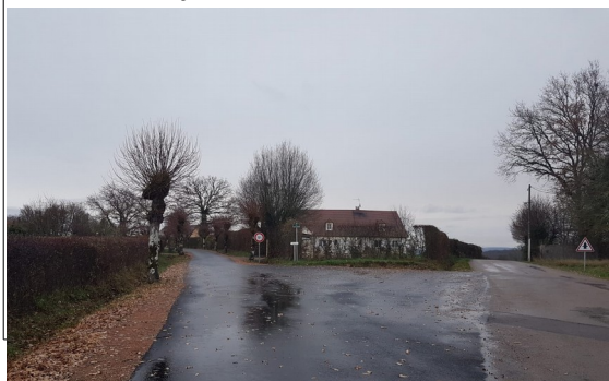
Carrefour de la rue des tilleuls