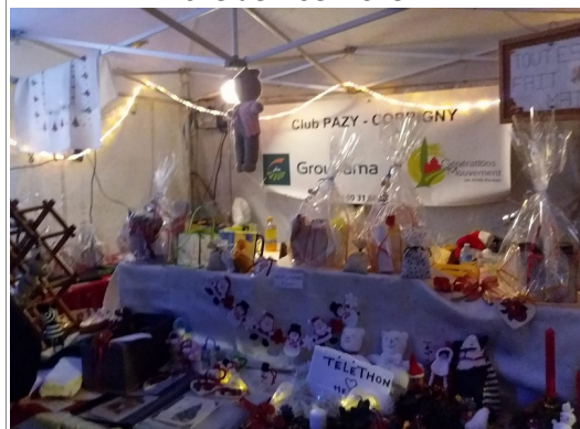
Stand de Génération mouvement au marché de Noël 2019

Il sera proposé à nos adhérents, lors de l'assemblée générale de février de renouveler gratuitement leur adhésion.